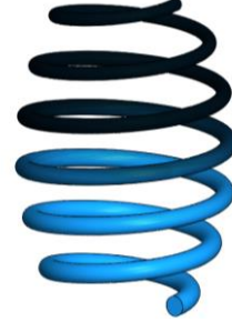
Şekil 3. Fonksiyonel derecelenmiş malzeme ve değişken kesitli varil tipi helisel çubuk

algoritma ve ANSYS programı kullanılarak belirlenmiştir. Şekil 3’de kesit ve malzeme değişimi gösterilmiştir.